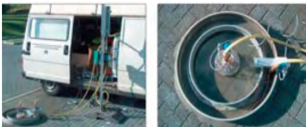
Dubbele ringproef 2019

Om het waterpeil constant te houden, is een constant waterdebiet nodig. Deze wordt gedurende 20 minuten gemeten om de doorlatendheid te berekenen.