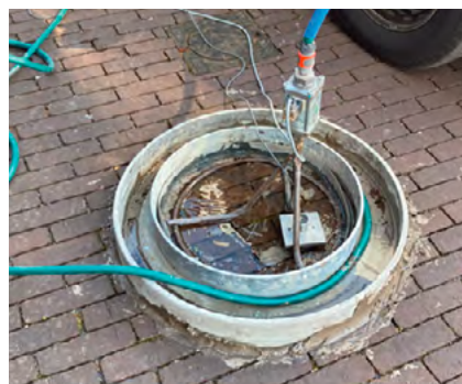
Dubbele ringproef - meetpunt 2022